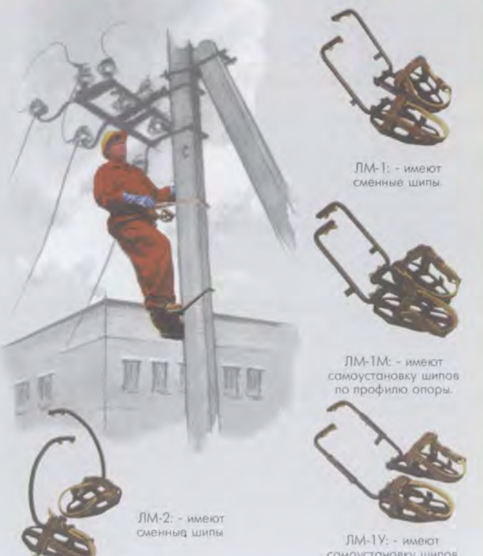
ЛМ-1: - имеют сменные шипы.