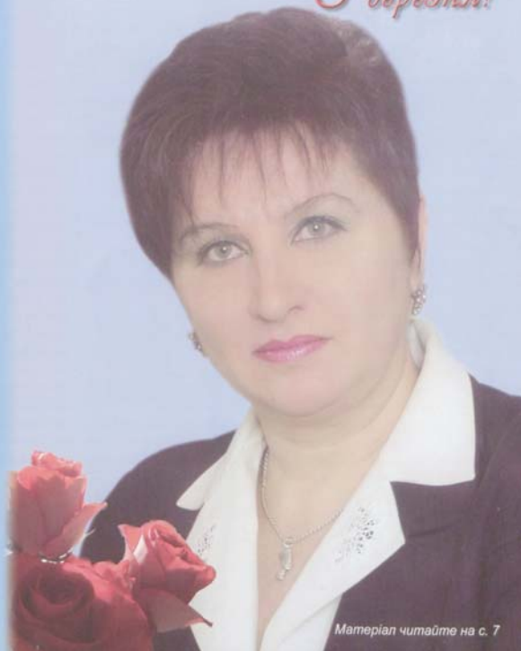
Матеріал читайте на с. 7