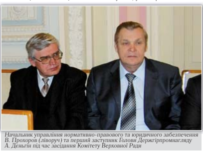
Начальник управління нормативно-правового та юридичного забезпечення в Прохорів (Львів) і перший заступник Голови Держгірпромнагляду А. Дениш під час засідання Комітету Верховної Ради

За ініціативою Уряду прийнято та реалізується Закон «Про підвищення престижності шахтарської праці». Послідовна робота Уряду щодо підвищення рівня безпеки на підприємствах Мінутелпрому дала зовнішній вплив у часті фінансової кризи втримати позитивну тенденцію щодо зменшення рівня виробничого травматизму (кількість травм на 1 млн. т видобутого коксу) у 2008 р. зменшилась по-