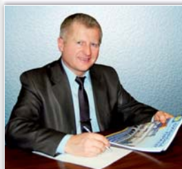
Шановні читачі! Дорогі друзі!