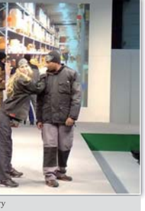
Демонстрація нових моделей спецвдягу

Потрібно зазначити: виставка за свідчення, що виробники прагнуть захищати та переконали споживача у тому, що спецодяг, спецвдягу та інші ЗІЗ мають бути не лише якісними, але й комфортними, бути надійними помічниками у справі охорони праці. Саме цю мету переслідували компанія, коли під час презентації своєї продукції влаштували справжній показ мод, здивували цікавими та різноманітними маркетинговими ходами.