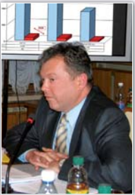
Виступає заступник міністра Мінпраці В. Іванків

На думку заступника міністра, рівень соціального захисту буде значно підвищено після прийняття і введення внесеного Кабінетом Міністрів на розгляд Верховної Ради проекту Закону «Про внесення змін до деяких законодавчих актів України щодо посилення вимог до здійснення профілактики виробничого травматизму, страхових виплат та надання соціальних послуг сім'ям загинув на виробництві». У ньому повністю враховано Рекомендації парламентських слухань стосовно обов'язку роботодавця відшкодувати шкоду в порядку зворотної вимоги (регресу) в разі неопорядкованого допущення аварій, які призвели до загинув людини або ушкодження його здоров'я; розроблення та запровадження механізму економічної зацікавленості роботодавця у забезпеченні