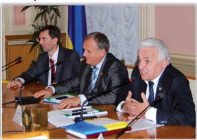
На парламентських слуханнях

Комітет з питань соціальної політики та праці Верховної Ради України вивідав незалежну роботу Кабінету Міністрів України з виконання рекомендацій парламентських слухань на тему: «Про хід виконання в Україні Європейської соціальної хартії (переглянутої)».