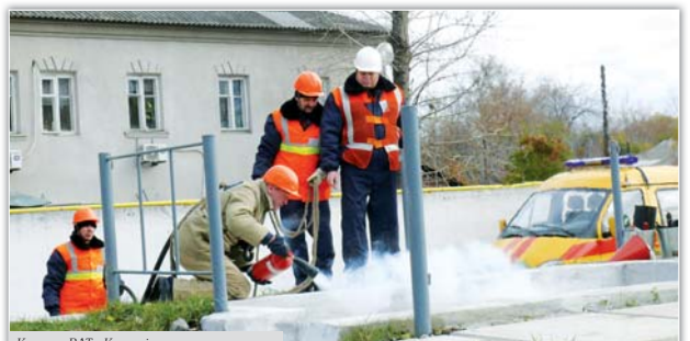
Команда ВАТ «Криворіжжя» гасить пожежу

На переможців конкурсу чекали дипломи за I, II, III місце та премії: