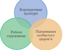
Мал. 1. Скалярні фактори формування здорового і безпечного робочого місця

Директор Європейського агентства Юка Такала навів статистику смертельних випадків, пов'язаних з виробництвом. Так, у світі щорічно помирає 2,3 млн. осіб від інфекційних, онкозаболювань, захворювань кровоносної системи, які виникли