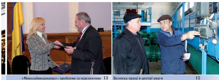
«Миколаївводоканал»: проблеми та перспективи 13