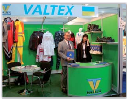
Стенд ТОВ «Валтекс» на виставці «А+А 2009»

Тим самим з метою переїняти сучасний досвід, налагодити ділові стосунки в галузі виробництва ЗІЗ варто відвідати виставку «А+А 2009». На 55-му роковому існування виставки номер один у світі в галузі охорони праці відбулася в листопаді 2009 р. в м. Дюссельдорфі (Німеччина) у виставковому комплексі «Messe